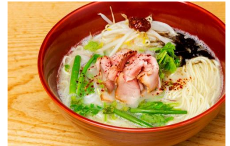
▲スパイストンコツソバ 900 円（税込）

ミシュランガイドに2年連続で掲載された実績を持つ名店「ソラノイロ」の新業態、「ソラノイロ トンコツ&キノ」では、日本で初めてラーメンのすべての素材に野菜を使った「ベジソバ」のほか、京橋エドグラン限定で「スパイストンコツソバ」が登場します。ラーメンだけでなく、コールドプレスジュースの販売もあり、女性が一人でも気軽に楽しめます。先着 200 名のお客様限定でタオルもプレゼント。