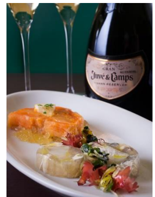
※画像はイメージです

創業 130 年を契機に「明治屋」が初めて展開するワインバー「明治屋ワイン亭」が B1F にオープンします。11 月 25 日（金）～27 日（日）の 3 日間、「エドグランオープン記念マリアージュセット特別限定メニュー」（限定 300 セット）として、「スパークリングワイン&アミューズセット」648 円（税込）、「白ワイン&オードブル盛り合わせセット」1,080 円（税込）、「赤ワイン&オードブル盛り合わせセット」1,188 円（税込）が登場。特別メニューをご注文のお客様には、明治屋ワイン亭特製「オリジナルソムリエナイフ」をプレゼント予定です。