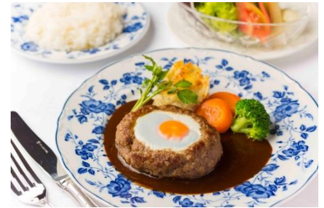
▲ハンバーグステーキ“シュバル風” 1,050 円（税込）

京橋の方々が復活を待ち望んだ老舗洋食レストラン「京橋モルチェ」では、オープン記念スペシャルセットとして、京橋モルチェ名物のハンバーグステーキ“シュバル風”スープ、サラダ、ライスが付いたスペシャルセットが通常 1,750 円（税込）のところ、1,050 円（税込）で楽しめるオープニングキャンペーンを実施。知る人ぞ知る名物支配人との会話も楽しめる名店が京橋エドグランに再登場です。